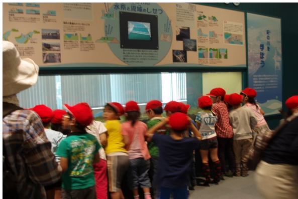
1Fの模型を見て水系を学習している様子