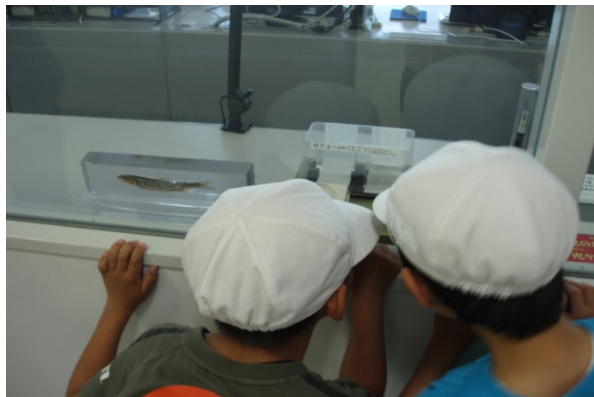
2F操作室前に展示されているアユの卵に興味を示している様子