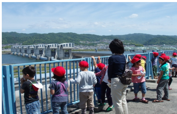
3F展望デッキで自分達の学校がどこにあるかを確認している様子