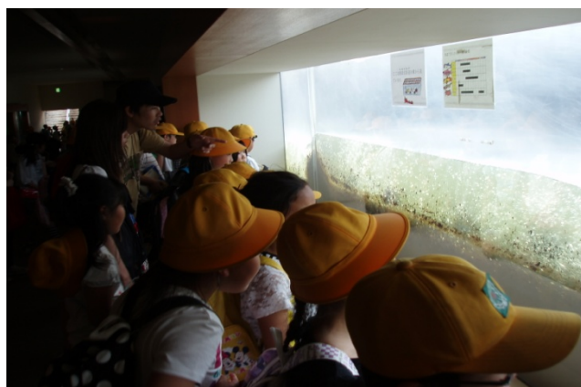
魚道観察室にて階段式魚道を横から観察

階段式魚道、デニールボックス付バーチカルスロット式魚道、人工河川式魚道を上から見て、それぞれの特徴を学んだ後、階段式魚道の横に設置された魚道観察室を見学。