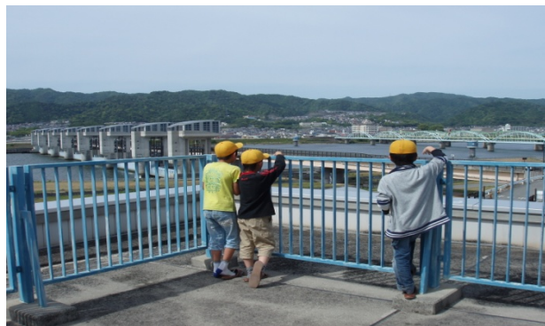
3Fの展望デッキから制水ゲートや、流量調節ゲートを見ている様子