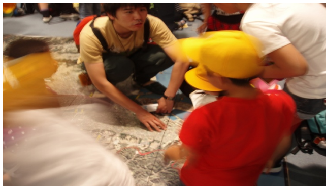
1Fの航空写真を熱心に見入る様子