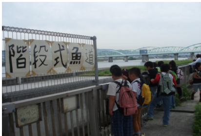
階段式魚道を上から見てみる

3.館内展示を見学後、きらめき館から徒歩約3分の魚道観察室へ移動 階段式魚道、デニールボックス付バーチカルスロット式魚道、人工河川式魚道を上から見て、それぞれの特徴を学んだ後、階段式魚道の横に設置された魚道観察室を見学。