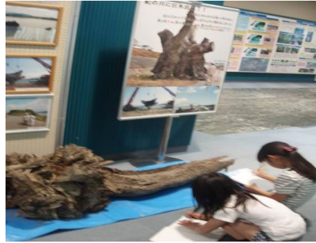
熱心にメモをとっている様子

1F館内展示物見学(巨大流木引き上げ)平成24年8月3日に紀の川大堰上流で引き上げられた幹回り12mの巨大流木写真を見入る