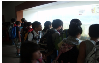
魚道観察室から階段式魚道の状況を観察