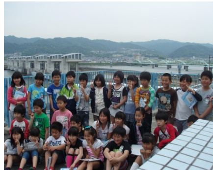
3F展望デッキで大堰をバックに記念撮影している様子

3.館内展示を見学後、きらめき館から徒歩約3分の魚道観察室へ移動 階段式魚道、デニールボックス付バーチカルスロット式魚道、人工河川式魚道を上から見て、それぞれの特徴を学んだ後、階段式魚道の横に設置された魚道観察室を見学。