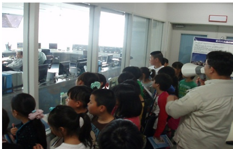
2F操作室に興味を示している様子

1F館内展示物見学(巨大流木引き上げ)平成24年8月3日に紀の川大堰上流で引き上げられた幹回り12mの巨大流木写真を見入る