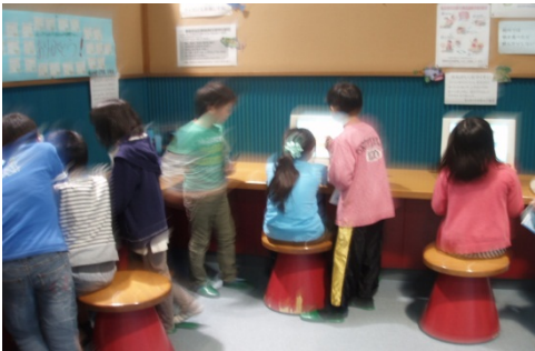
皆で一緒にパソコンのクイズを考えている様子