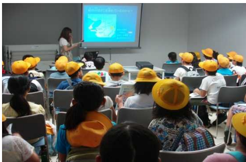
説明を聞いている様子

紀の川の概要、紀の川大堰の目的、紀の川大堰についてスライドを用いて吉川非常勤職員が説明