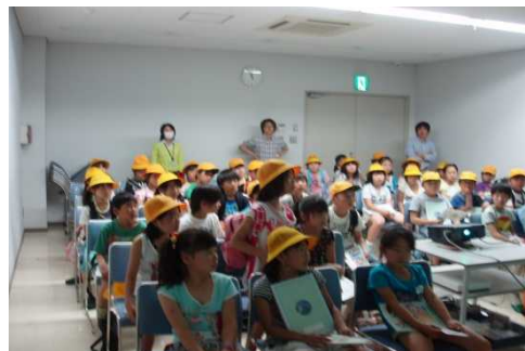
積極的に質問している様子