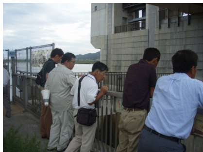
階段式魚道を上から 観察