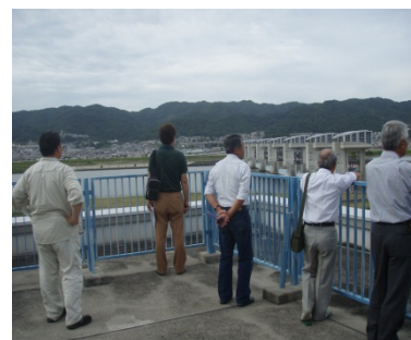
3F展望台から、紀 の川大堰を眺めて いる様子