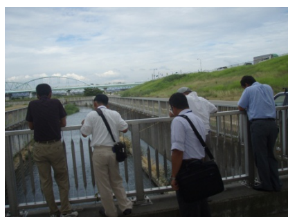
人工河川式魚道を上 から見てみる