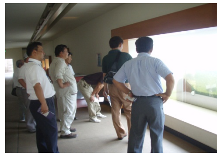
魚道観察室から階段式魚 道の状況を観察