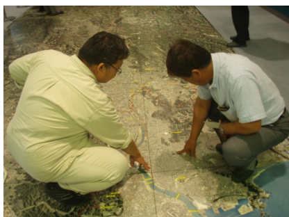
館内展示物見学 (紀の川流域 航空写真)