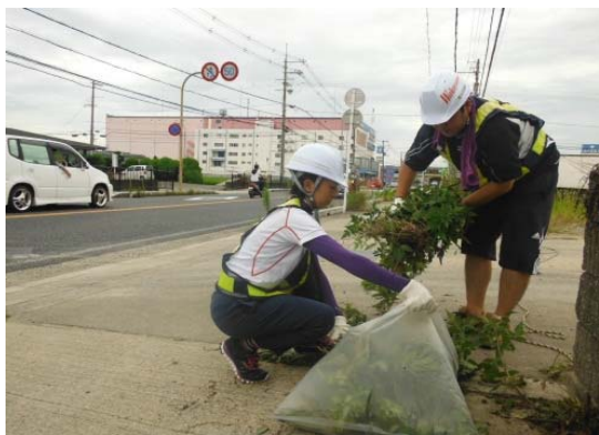
あちこちに草が生えているなあ、 除草は大変だなあ