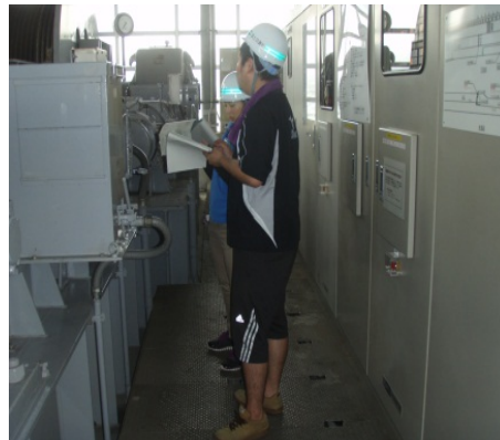
自分達で点検していくのは、なかなか大変だなあ