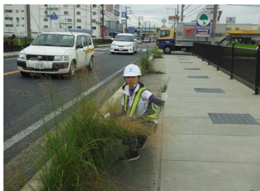
除草しながらハイポーズ！！