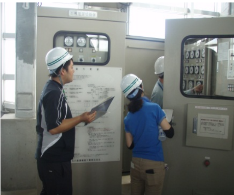
どこを点検するか熱心に聞いている様子