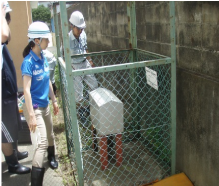
四箇郷小学校にこんなものがあつたんだあ