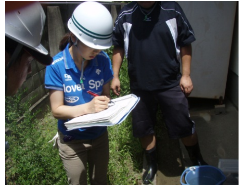
一つ一つ記録している様子

感想・学校内にこのような施設があるのは知らなかった。 ・水質の調査の結果、見た目は綺麗だが、鉄分が多く飲めない水であると分かった。