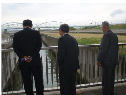
人工河川式魚道を上から見てみる