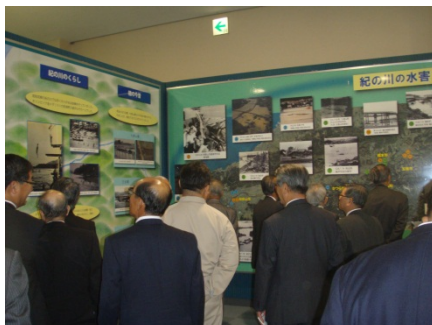
紀の川の水害のパネルの説明を聞いている様子