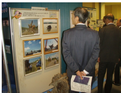
巨大流木の大きさに圧倒している様子