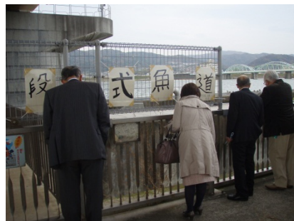
階段式魚道を上から観察