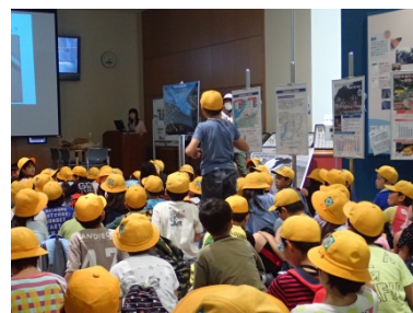
質問している様子