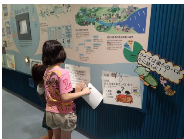
1Fの館内クイズに挑戦している様子