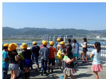
3F展望デッキから、紀の川大堰を見ている様子