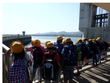
階段式魚道を上から見てみる