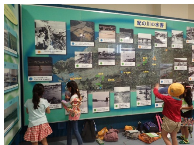
水害に興味を示している様子