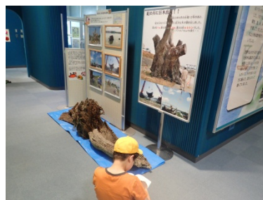
こんな大きな木が紀ノ川にながれてきたんだなあ