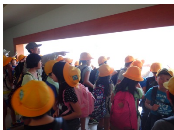
魚道観察室から階段式魚道の状況を観察 魚を発見!!!