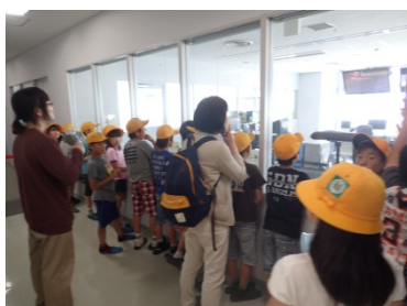
2F操作室の広さに圧倒している様子