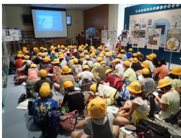
熱心にメモする様子