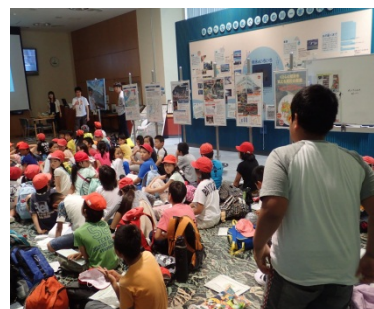
質問に答えている様子