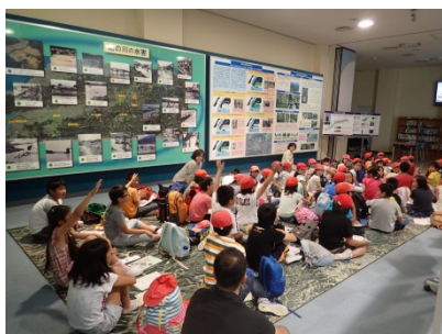
積極的に手を挙げる様子