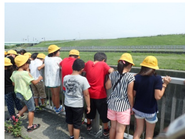
階段式魚道を上から見てみる 魚がたくさんいるなあ