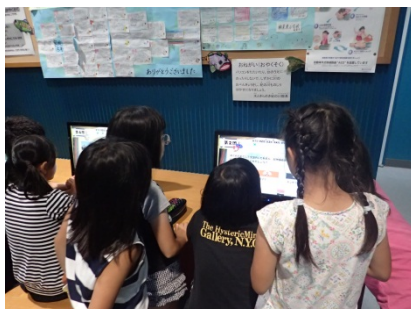
パソコンサイズに夢中になっている様子