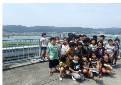
3F展望デッキにて記念撮影！