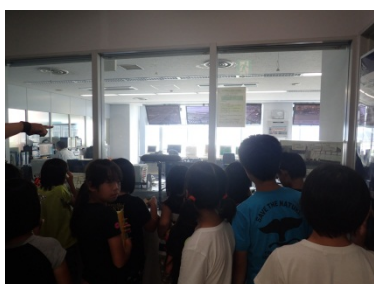
2F操作室に展示しているアユの卵に興味を示している様子