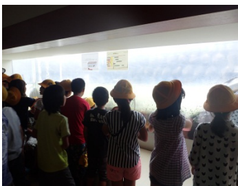
魚道観察室から階段式魚道の状況を観察