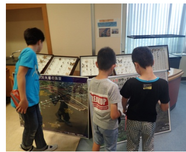
こんな昆虫初めて見たなあ