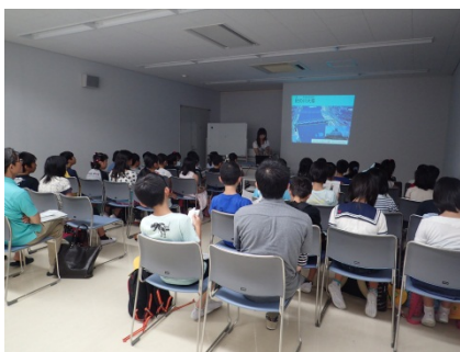
熱心に説明を聞く様子