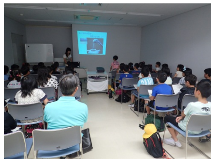
問題に答えている様子