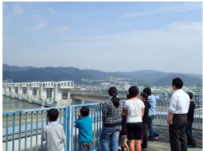
紀の川大堰を一望できる3F展望デッキ わあ、大きい!!