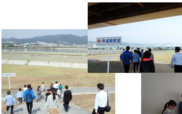
階段式魚道の可動装置を 覗く児童たち