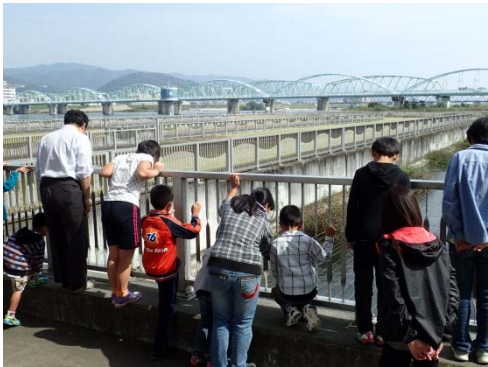
大きな魚がたくさんいるよ すごいなあ