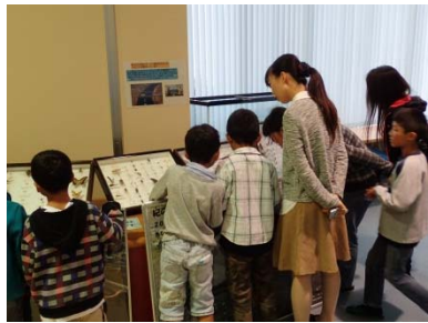
紀の川の近くにはいろんな昆虫がいるんだね