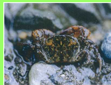
平成12年の第1回移植時の台湾ヒライソモドキ(オス)。移植は4回行われています。

また、名前の由来ですが、「台湾からの外来種」というわけではなく、生息地域が関係しているのではないかと思います。他にも「台湾～」や「～モドキ」という名のカニがいるようです。