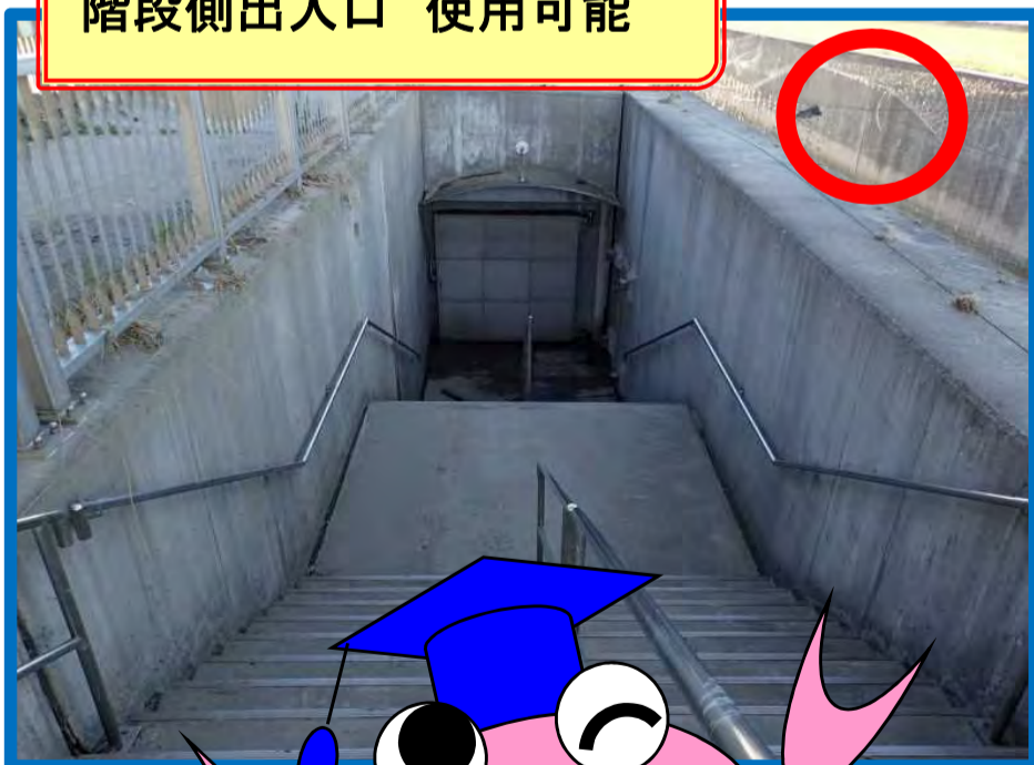
階段側出入口 使用可能