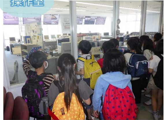
和歌山市立有功東小学校4年生