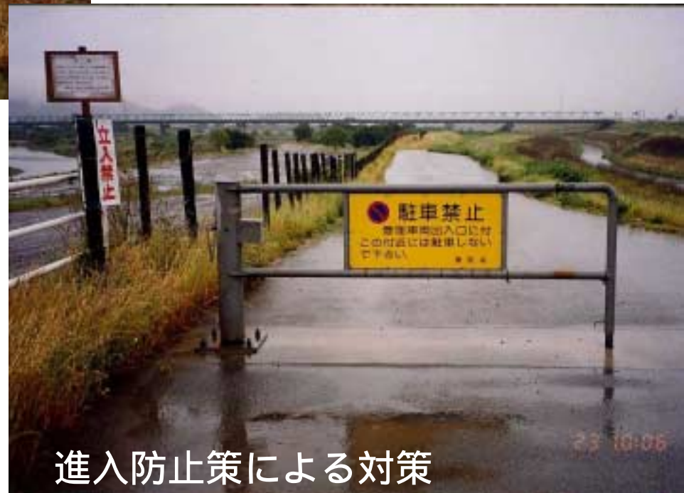
進入防止策による対策