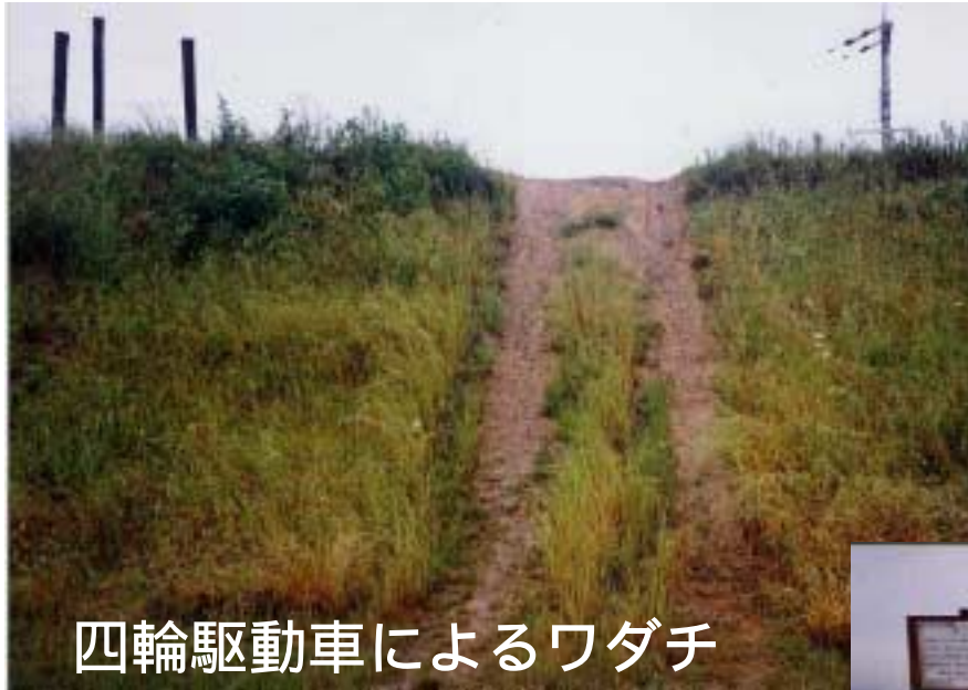
四輪駆動車によるワダチ