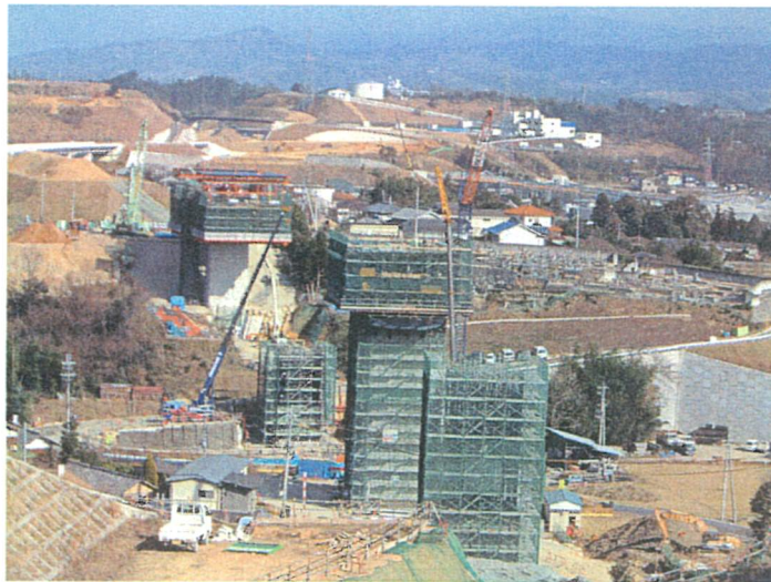
なかじま 中島高架橋（1 工区）