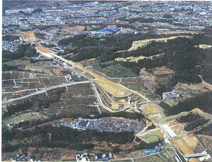
すだちょうこうぜ 橋本市隅田町河瀬付近