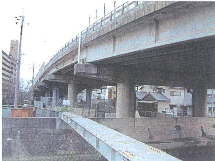
きつねじま 国道 26 号 狐島高架橋