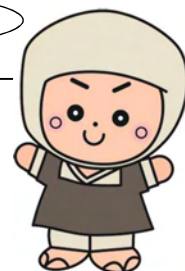
岩出市イメージキャラクター そうへいちゃん