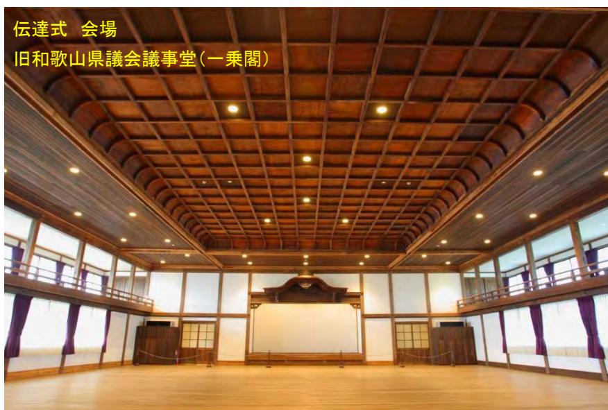
伝達式 会場 旧和歌山県議会議事堂(一乗閣)