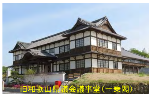
旧和歌山県議会議事堂(一乗閣)