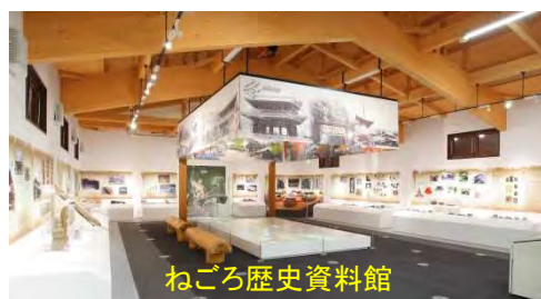
ねごろ歴史資料館