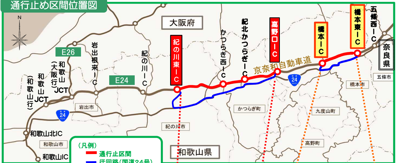
通行止め区間位置図

高野口IC～紀の川東IC 3月15日（予備日3月16日） 夜間通行止め（22時～翌朝5時）