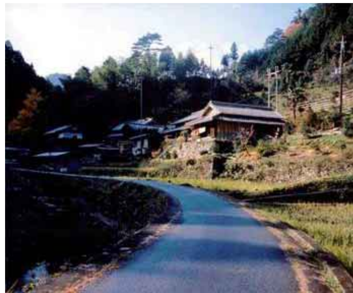
現在の北又川の状況(撮影場所は違います)