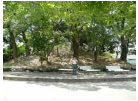
(八尾高校校庭の狐山)

大和川つけかえま では幅の広い大きな川でした。八尾高校の狐山も昔の大和川の堤防の一部だと言われています。