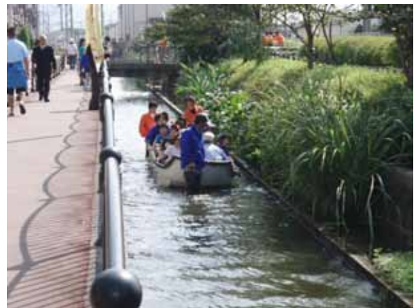
収穫祭はボートに乗って

育っている植物 ：ジュズダマ、キショウブ、ガマ、ショウブ、シュロガヤツリ、ポンテデリア、ミズカンナ、オモダカ、イグサ、フトイ、ミニパピルス、アサザ、セリ等