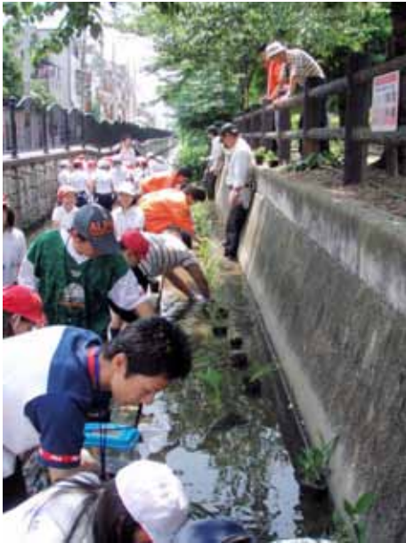
水生植物を植えました

コンクリートの川底の一部に、ヤシガラマットをしけるように工事がされ、小学生と一 いっしょ 緒に水生植物を植えました。そ