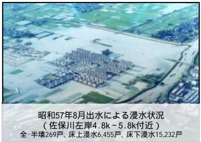
昭和57年8月出水による浸水状況 (佐保川左岸4.8k～5.8k付近) 全・半壊269戸、床上浸水6,455戸、床下浸水15,232戸

河川における対策 ・河道掘削(河道拡幅、河床掘削、低水路拡幅)、堤防整備、浸水防止対策、護岸嵩上、引堤、高規格堤防整備、堤防強化対策、堰改築、遊水地整備、橋梁架け替え、樋門設置、バイパス水路開削、井堰改築