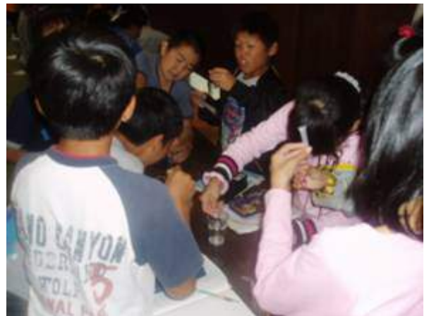
パックテストにチャレンジ!!