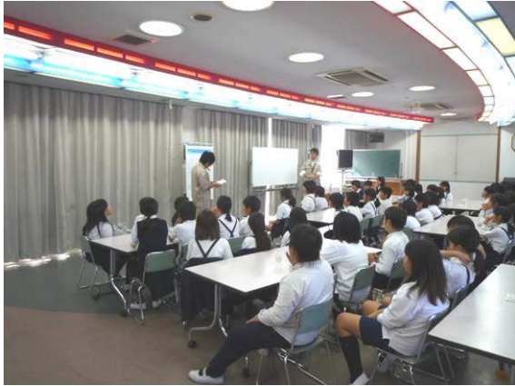
大和川の概要について

今回、私たちのお話を聞いてくれたのは、松原市立天美北小学校4年生の皆さんです。今回は大和川の概要、付け替え、自浄作用の説明、水の汚れを検査するパックテストを体験してもらい、最後に大和川的环境や生き物についてのお話をしました。