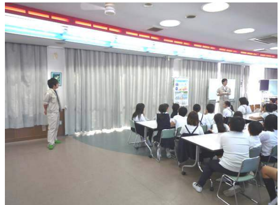
自浄作用について