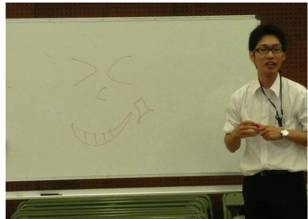
「微生物くん」を例に、自浄作用のお話し

生き物のお話では、アユやウナギがすんでいる話や、大和川でウナギ漁をしていることを聞いて、みんな声を上げてびっくりしていました。