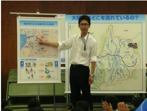
大和川の概要について

今回、私たちのお話を聞いてくれたのは、大阪市立敷津浦小学校4年生のみなさんです。今回は大和川の概要、付け替え、治水、自浄作用の説明、水の汚れを検査するパケットテストを体験してもらい、最後に大和川の水質や生き物についてのお話をしました。