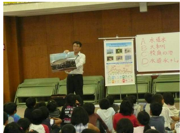
大和川に住むアユのお話し