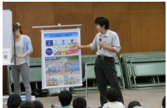
自浄作用のお話し

生き物のお話では、アユやウナギがすんでいることを聞いて、みんな声を上げてびっくりしていました。