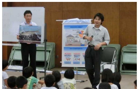
大和川に住むアユのお話し