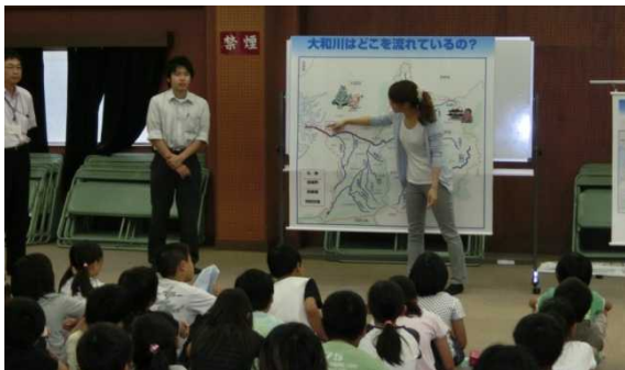
大和川の概要について