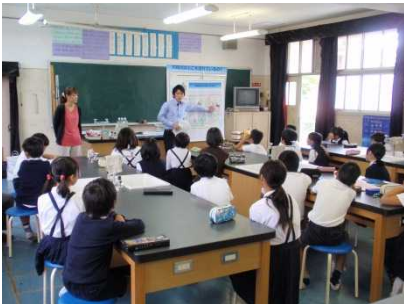
みんな真剣に聞いてくれました！

● みんな大和川の概要、治水の話をもっと真剣に聞き、大和川クイズには積極的に参加してくれました。