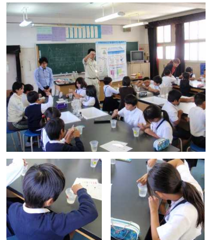
みんな真剣に実験中