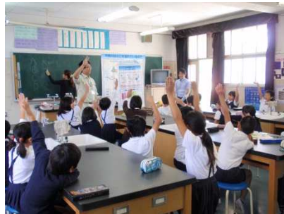
予想では、みんな声をそろえて「学校の池の水」が一番汚いと…

● パックテストでは「A.大和川の水」「B.学校の池の水」「C.水道水」「D.水道水+しょう油1滴(生活排水)」で実験しました。