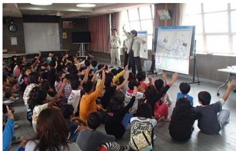
大和川のクイズ！ 大和川の歴史は完璧だったね！