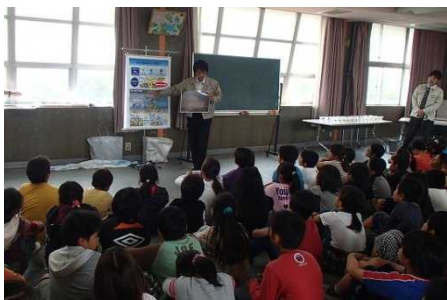
環境のお話 みんな真剣に聞いてくれました！