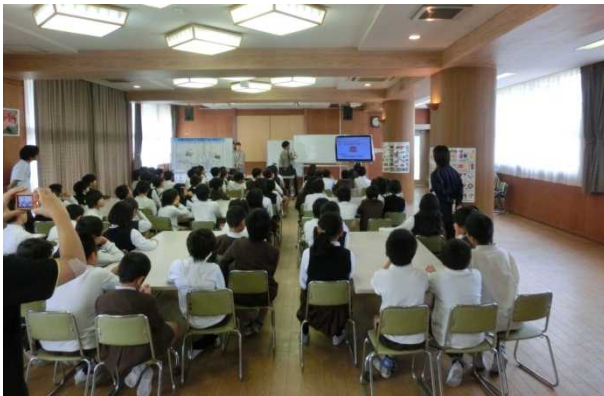
みんな真剣に聞いてくれました！