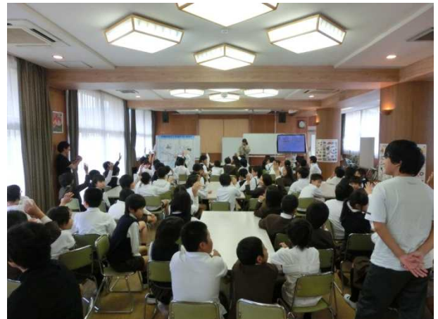
手を挙げて答えてくれましたよ～！