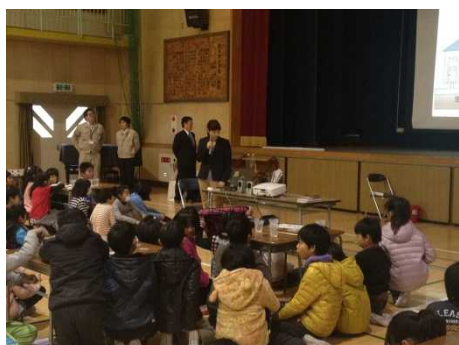
パックテストではみんな黙々と実験してます！