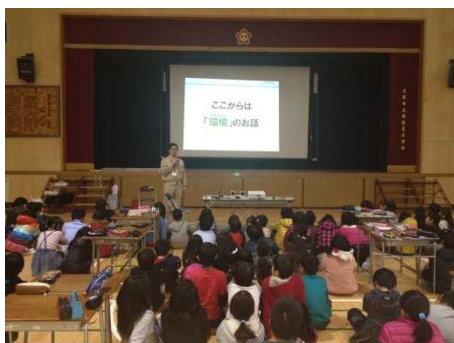
難しい話も真剣に聞いてます！