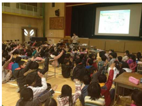
積極的にクイズに参加しています！