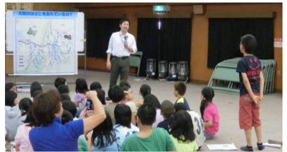
みんないっぱい質問したね！