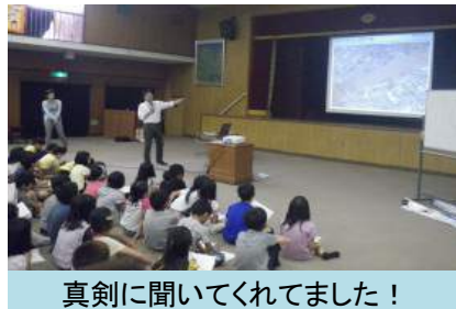
真剣に聞いてくれました！