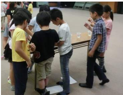
どの水が一番汚いかな？

パックテストでは「大和川の水」「学校の池の水」「水道水」「水道水＋醤油1滴(生活排水)」で実験しました。どの水が一番汚いか、みんなに予想してもらったところ「大和川の水」が一番きたないと予想されました。はたして結果は…！？