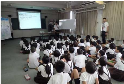
みんな真剣に話を聞いてます！

授業では、大和川の概要から始まり、大和川の歴史や大和川河川事務所で行われている仕事(治水や環境)のお話をしました。