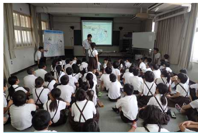
積極的に質問もしてくれました！

パックテストでは、「大和川の水」・「学校の近くの川の水」・「水道水」・「水道水+醤油1滴(生活排水)」の4種類の水を使用しました。また、実験前にどの水が一番汚いか、みんなに予想してもらったところ「水道水+醤油1滴(生活排水)」が一番きたないと予想されました。