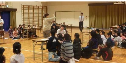
みなさん実験に興味津々！

予想では「学校の池の水」が一番汚いと予想した人が多く、先生たちも苦笑い…。しかし、「水道水+醤油1滴(生活排水)」が一番汚いという結果になり、環境にとって何が悪影響なのか学ぶことができました。