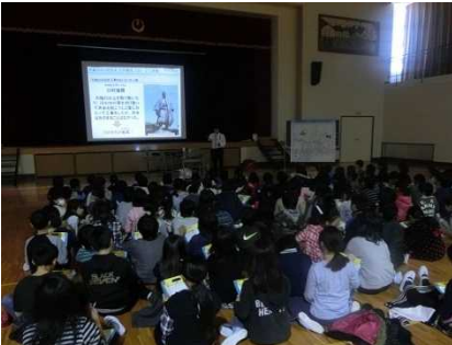
みなさん真剣に話を聞いてます！

講座中は、真剣に話を聞いてくれて、メモをとる姿もよく見られました。また、生き物の話には、みなさん興味津々で、たくさんの質問もいただきました。