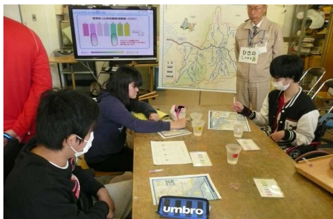
パックテストによる実験の様子