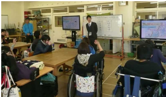
大和川の長さは何kmくらいだろう？

今回、私たちのお話を聞いてくれたのは 大阪府立藤井寺支援学校 のみなさんです。大和川のことを初めて勉強する人もたくさんおられましたが、一生懸命メモを取ったり、質問したりしてくれました。