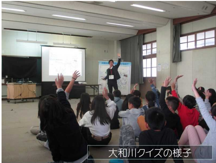
大和川クイズの様子