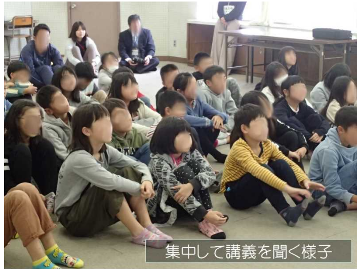
集中して講義を聞く様子