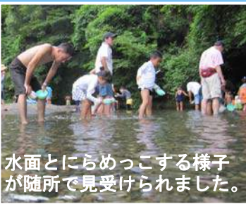
水面とにらめっこする様子が随所で見受けられました。