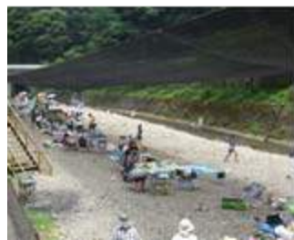
キャンプ場は朝から多くの家族で大賑わい。

夏休み親子参加特別企画として実施した河内長野市滝畑「石川上流」での水生生物調査。調査地点であるキャンプ場に遊びに来ていた家族連れにも呼びかけ、52名の方にご参加いただきました。