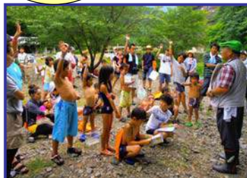
テキストを使っておさらいもします。みんな熱心。