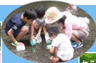
いろいろいるんだ～とバケツをのぞきこむ参加者たち

大型の水中メガネやゴーグルをして、みんな奮闘！ なんとか魚を捕まえようと頑張りました。