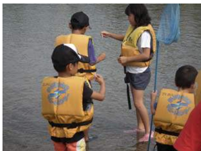
大和川の水を入れて