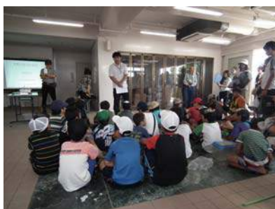
水が多い時には川に入らないでね