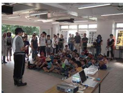
楽しい調査のスタートです

で、子どもたちは川で遊ぶための諸注意を聞いた後、水質をはかったり、川に入って魚とりや水遊びをしたり、親子で虫とりをしたりと、楽しみながら体全体で大和川的环境と生き物について学んでいました