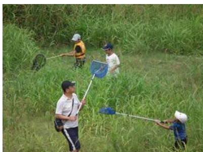
お父さんも一緒に