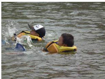
暑いので川遊び中～