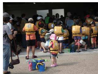
ライフジャケットを着て準備完了!