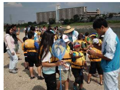
結果はどうかかな?