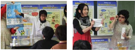
コートを交えた大和川博士講座は楽しいですよ！

第一部は大和川の水質の現状や生活排水が川を汚す原因、生活排水を削減するために、主婦コートを交えて家庭でできる取り組みを大和川博士が分かりやすく講演しました。