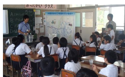
たくさん質問してくれてありがとう！