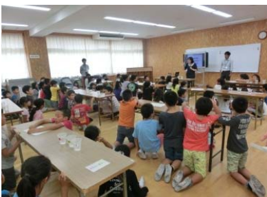
実験の説明をよく聞いてね！

パックテストでは、「B:学校のプールの水」「C:水道水」「D:水道水+醤油1滴」を使いました。実験前のみんなの予想では「B:学校のプールの水」が一番汚いと予想しましたが、実験の結果は「D:水道水+醤油1滴」(=生活排水)でした。プールの水はきれいだったので、みんな安心していましたが、醤油1滴で水が汚れてしまうことにおどろいていました。