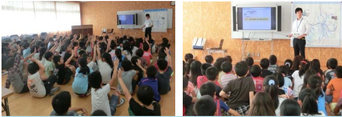
みんな真剣に話を聞いてくれました！

今回、私たちのお話を聞いてくれたのは 高石市立高陽小学校4年生 のみなさんです。みんなが積極的に参加できるよう、クイズや昔話を使って授業をすすめました。