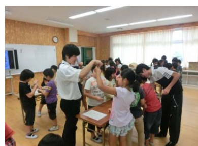
色の変化におどろいたね！