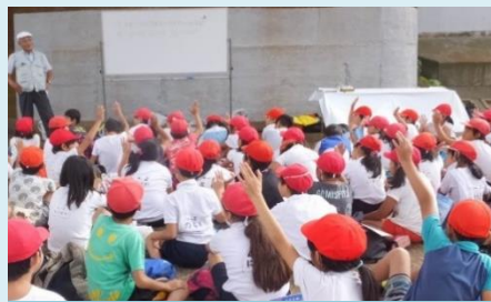
元気よく手をあげて答える生徒たち