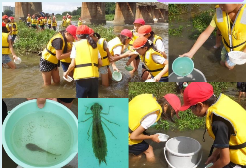
珍しいギンヤンマのヤゴやウシガエルのオタマジャクシなど 次々と生き物を発見する子どもたち