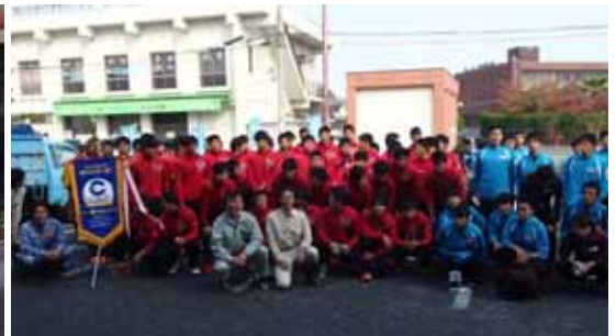
清掃後の記念撮影