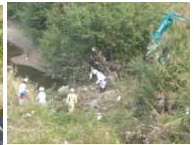
樹木に付いたゴミの撤去作業