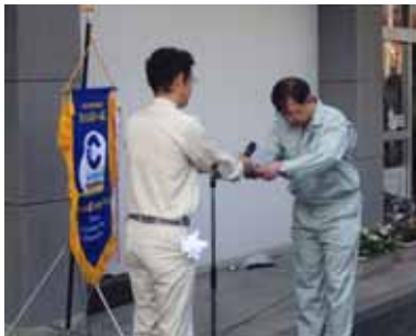
会長から町長へ目録を贈呈