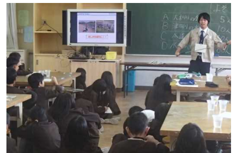
真剣に聞いてくれてありがとう！