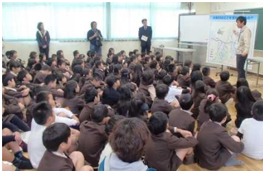
たくさんの方が聞いてくれました

今回、私たちのお話を聞いてくれたのは 岸和田市立旭小学校4年生 のみなさんです。社会で習っていないお話もあり、みんなメモを取りながら真剣に聞いてくれました！