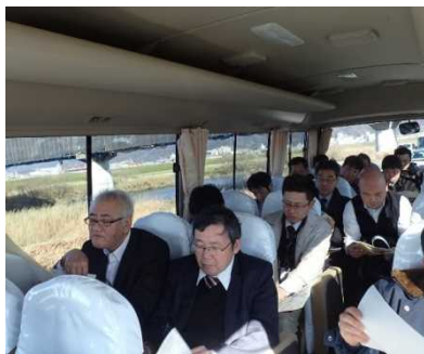
マイクロバスで移動