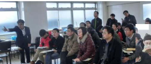
担当者の説明を真剣に聞く参加者