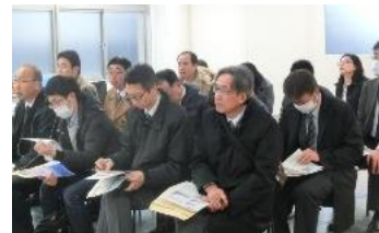
矢作川堤防リフレッシュ事業推進協議会