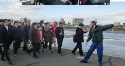
中国浙江省治水・利水関係者視察団

※浙江省は中国沿海部、人口約5,500万人、面積約10万km 2 の都市。中国有数の工業地帯で治水・利水両面でさまざまな課題がある。