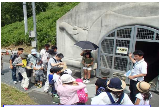
地下水を集める施設(排水トンネル)