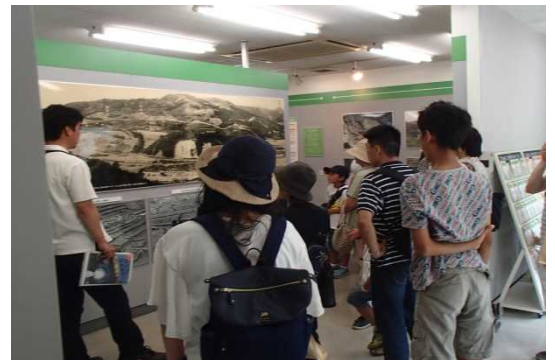
地すべりの歴史・メカニズム説明