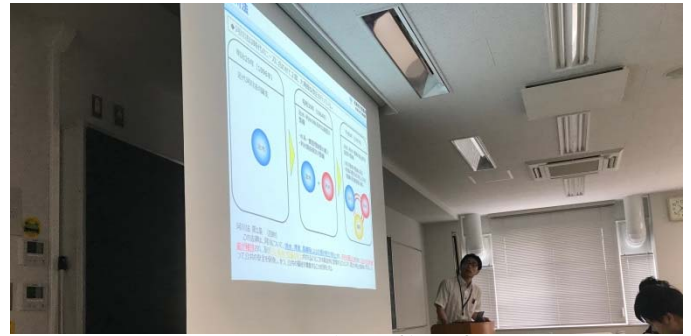
大和川水系河川整備計画