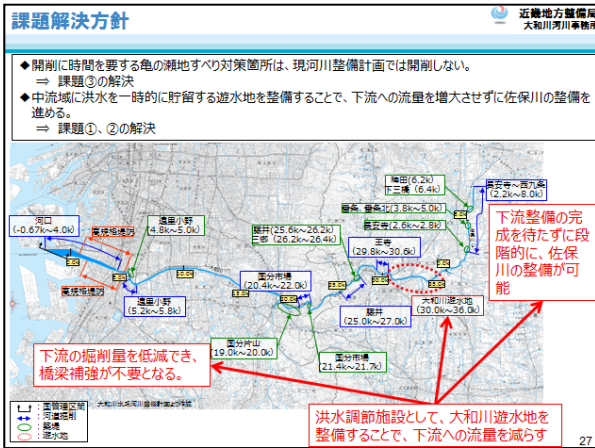
大和川河川整備計画の資料