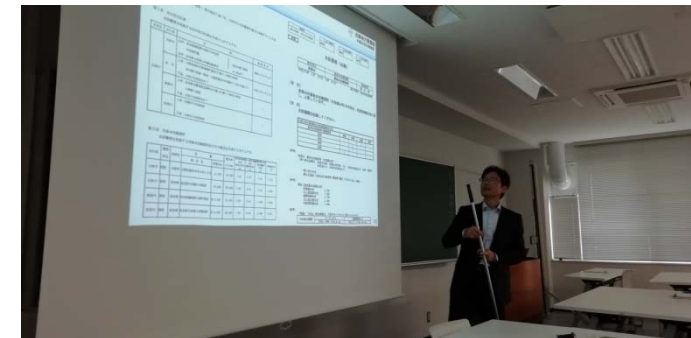
洪水予報と水文観測