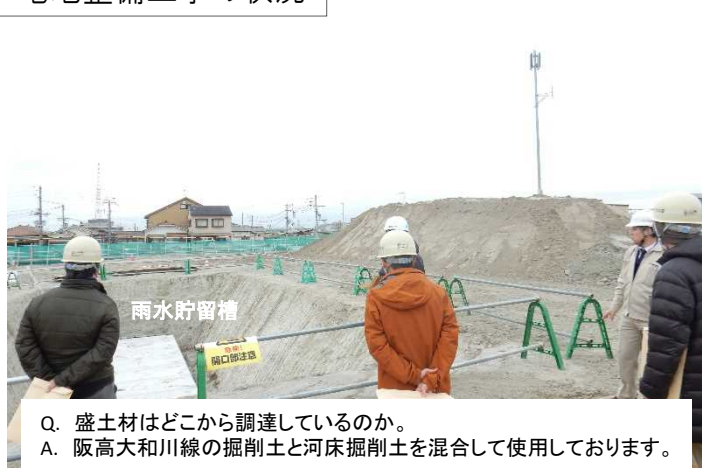
宅地整備工事の状況