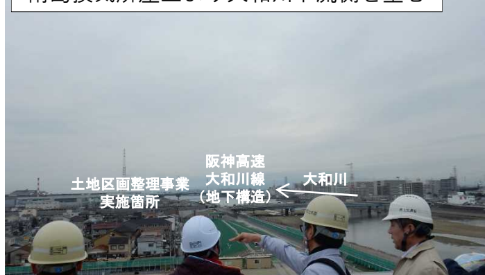
南島換気所屋上より大和川下流側を望む