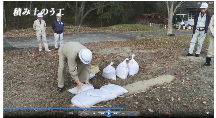
水防工法ビデオ(近畿技術事務所製作)の紹介 ※大和川河川事務所 以下HP掲載