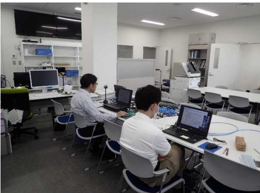
講習会(WEB会議)の様子