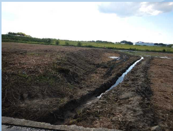
遊水地内の表土をとってます。 (9月末時点)